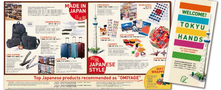
外国人観光向けお土産パンフレット