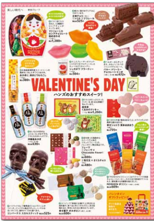
バレンタインチラシ