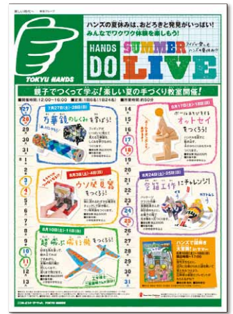
夏休みイベントチラシ