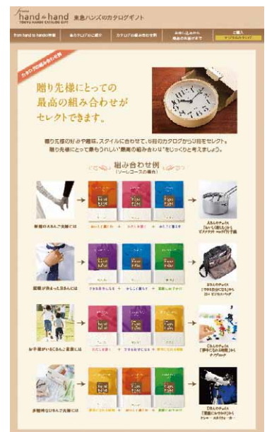
「from hand to hand」Web サイト