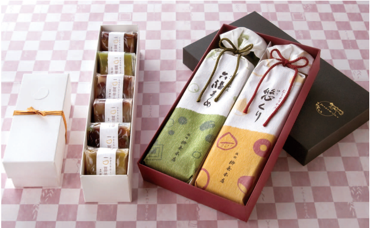
店頭資材・商品パッケージ

成田山新勝寺の門前町を表現した新勝寺包装紙、社名を表した柳の木をモチーフにしたレギュラー包装紙を担当。また、有名百貨店やショッピングセンターの催事の際には、VMD や付属品のPOPや菜、カタログなどの 캄프の提案も行っている。いずれも創業100有余年の歴史を意識し、日本人の心を表すデザインを心掛けて制作している。