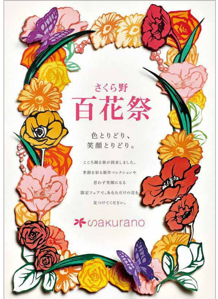
百花祭B1ビジュアルポスター