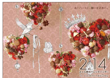
バレンタインデー・ホワイトデーB3ビジュアルポスター