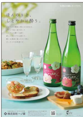
ひめぜん/A4リーフレット