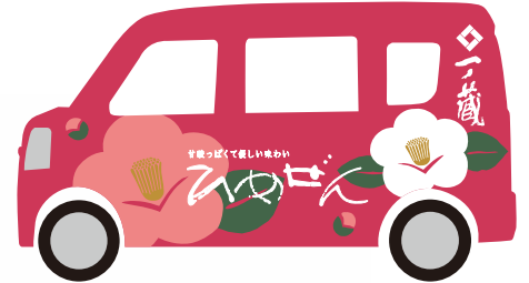
ひめぜん/ラッピングカー

1988年発売の低アルコール酒「ひめぜん」のデザインリニューアル企画を受注し、お酒のラベル・首掛けしおり・販促ツール(A4リーフレット・三つ折パンフレット・テーブルテント等)の企画・デザイン・製造をトータルで担当。商品のコンセプトである爽やかな酸味と柔らかな甘みを、つばきをモチーフにしたラベルや首掛けしおりで表現した。