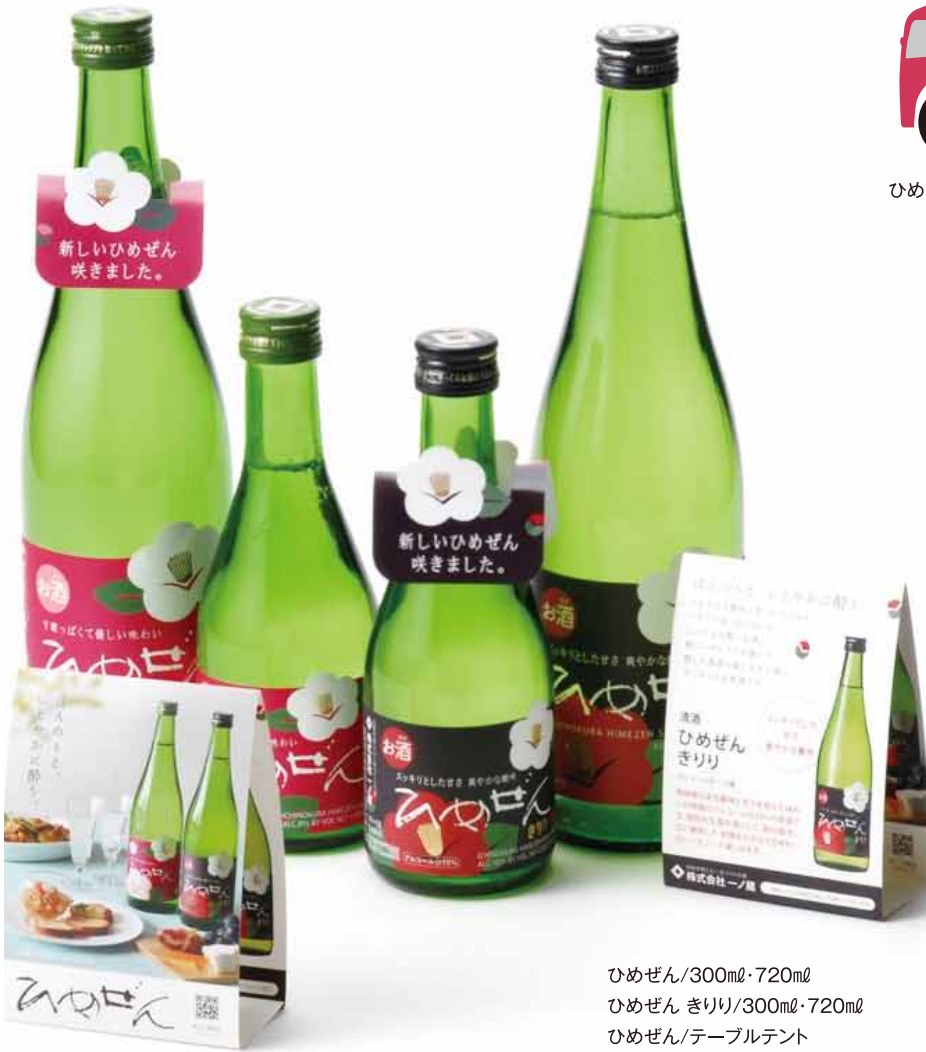
ひめぜん/300ml・720ml ひめぜん きりり/300ml・720ml ひめぜん/テーブルテント