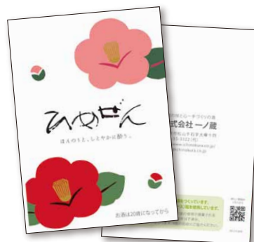
ひめぜん/三つ折りパンフレット