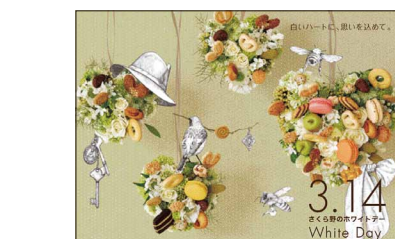
バレンタインデー・ホワイトデー-B3ビジュアルポスター