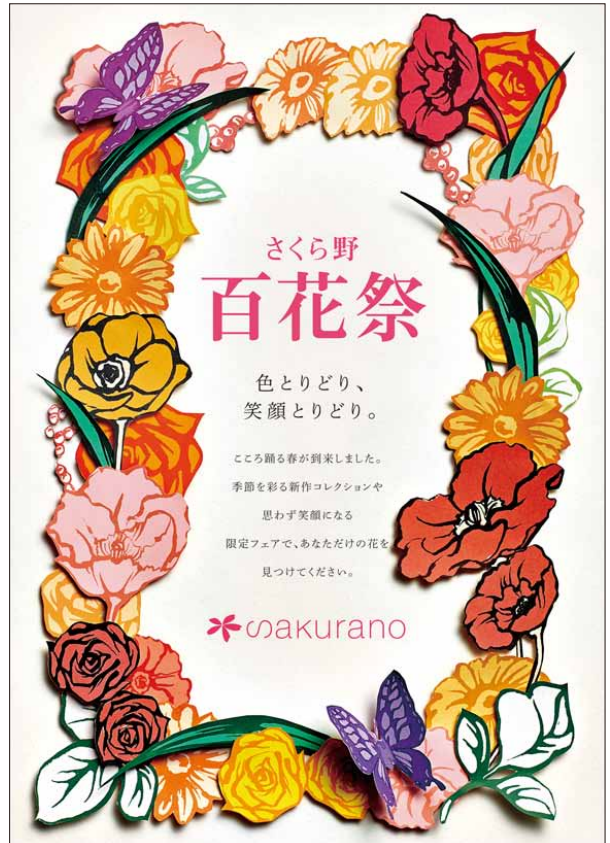
百花祭B1ビジュアルポスター