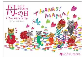
母の日・父の日B3ビジュアルポスター