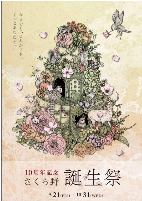
誕生祭B1ビジュアルポスター

各種社会歳時キャンペーンから全館セールスキャンペーンまで、販売促進の顔となるコミュニケーションビジュアルの企画&クリエイティブを、年間を通してサポート。ポスターをはじめ各種店内演出ツールの作成から、折込みチラシ、DM、WEB サイトに至るまで、トータルにビジュアルコーディネートを実施している。